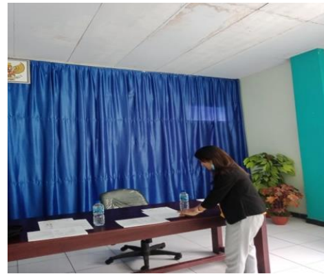
Gambar 1. Persiapan kelengkapan workshop (NCP, Juknis, Pre/post test)

Proses identifikasi masalah pada Rumah Sakit Daerah Kabupaten Masohi di dapatkan bahwa pada 2 tahun sebelumnya telah dilakukan sosialisasi tentang SDKI, SLKI dan SIKI oleh TIM PPNI DPK RSUD Haulussy Ambon akan tetapi dalam rencana tindak lanjut belum terealisasi dengan baik dikarenakan beberapa masalah yang belum dapat teratasi serta faktor pendukung penunjang lainnya. Kemudian dalam proses identifikasi masalah dari RTL sebelumnya belum ada terkait pembuatan NCP berdasarkan SDKI, SIKI dan SLKI, JUKNIS serta SPO.