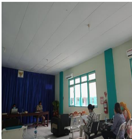
Gambar 3. Sesi tanya jawab dalam FGD setelah dilatih pengisian NCP.

ketua tim dan perawat dalam cara membuka buku SDKI, SLKI dan SIKI serta mengajarkan teknik pengisian pendokumentasian berdasarkan SDKI, SLKI dan SIKI secara benar dan tepat dengan petunjuk klinis yang ada serta draf NCP berdasarkan standar SDKI, SIKI dan SLKI. Selanjutnya dalam proses FGD pun berlangsung proses tanya jawab.