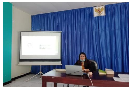
Gambar 2. Proses diseminasi ilmu

Proses diseminasi yang dilakukan dihadiri oleh perwakilan 22 orang yaitu kepala bidang keperawatan, kepala seksi, 2 staf bidang keperawatan dan perwakilan kepala ruangan/ketua tim, perawat pelaksana 18 orang dari setiap ruangan inap yang ada di Rumah Sakit Umum Daerah Kabupaten Masohi yaitu; ruangan mawar, ruangan teratai, ruangan IGD, ruangan VIP, ruangan dahlia covid, ruangan ICU, dan ruangan melati. Pada proses kegiatannya diawali dengan pre test dan selanjutnya kegiatan diseminasi setelah itu ada dalam FGD dan diakhiri dengan post test.